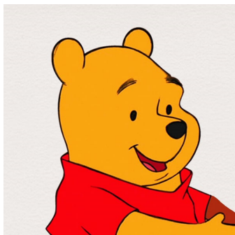
Winnie de Pooh