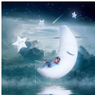
Een ster of maan