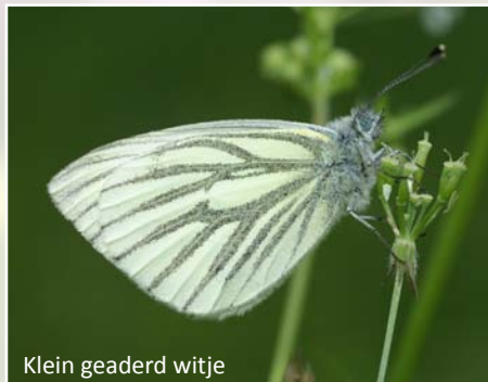
Klein geaderd witje